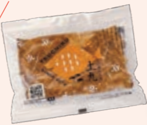
土九のたい焼き たい焼き工房土九