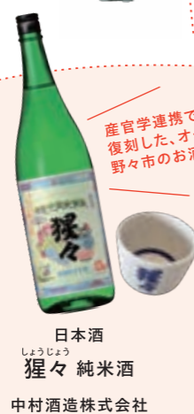
日本酒 しょうじょう 野々市 純米酒 中村酒造株式会社

野々市ならではの食材を使ったお菓子やかきもち、手づくり雑貨など多彩な品揃え。市の公式キャラクターのっティグッズも豊富です。お土産探しにお立ち寄りください!