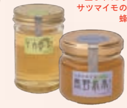
しずく工房のはちみつ しずく工房