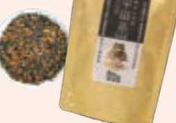
林さんちの宇宙茶 株式会社 林農産