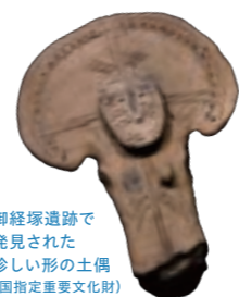
御経塚遺跡で発見された珍しい形の土偶(国指定重要文化財)

10:00-16:00 休館日 月曜 (祝日の場合は翌日)、祝日の翌日 (土日は除く)、年末年始 入館料 無料