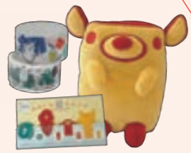
市公式キャラクター のっティグッズ 野々市市観光物産協会