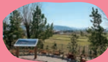
椿山ビュースポット