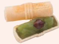
最中 勸進帳 ふがく堂