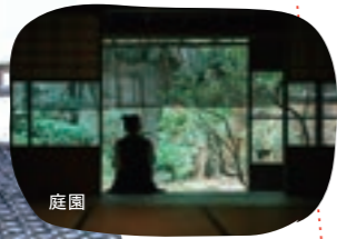
国指定重要文化財 喜多家住宅

江戸時代の金沢城下の建築様式を今に伝える洗練された木造建築。重厚な梁に支えられたお座敷、灰模様の描かれたいろり、優美な庭園など、当時の生活をしのぶことができます。