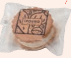
アイパウンド 菓子工房エクラン