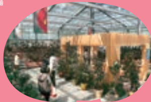
くつろぎスペース