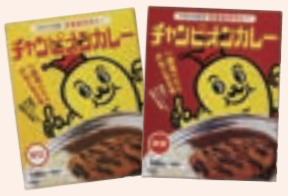
チャンピオンカレー (レトルト) 株式会社チャンピオンカレー