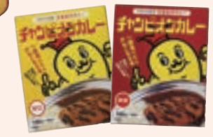
チャンピオンカレー (レトルト) 株式会社チャンピオンカレー