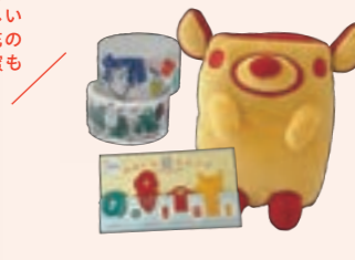
市公式キャラクター のっティグッズ 野々市市観光物産協会