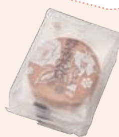
野々市煎餅 愛と和 野々市市観光物産協会